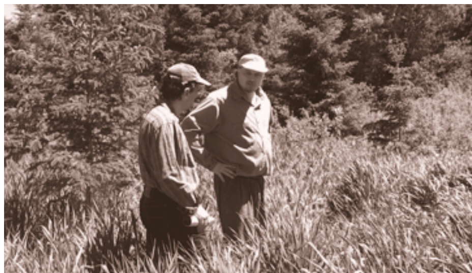
Un regarni d'épinettes et de sapins ne semble pas fonctionner.

Pour ce passionné de la forêt constamment à la recherche de nouvelles idées et