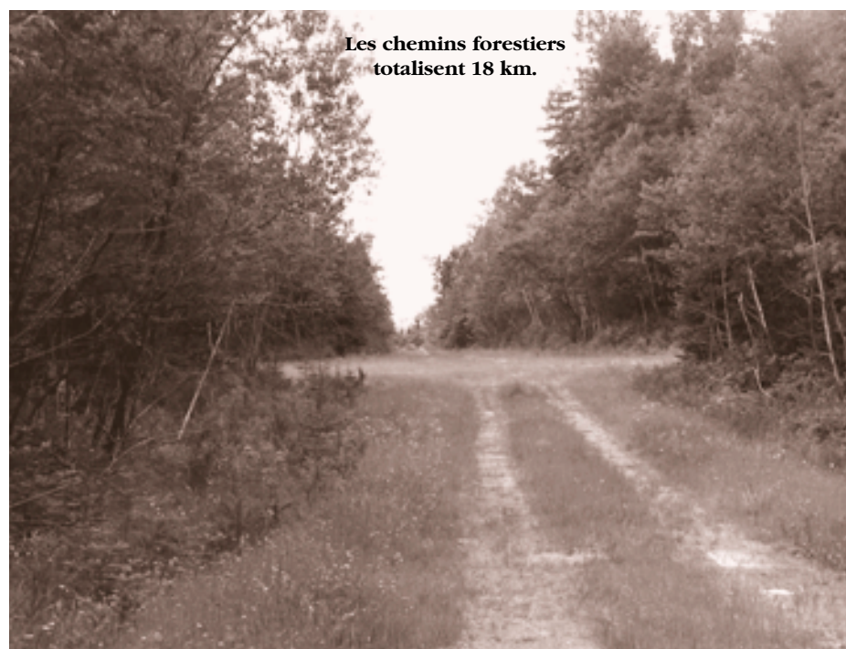
Les chemins forestiers totalisent 18 km.

À constater le souci de ce producteur pour entretenir et préserver ses boisés, nous étions curieux de connaître son degré de sensibilité concernant l'environnement. Sa réponse est éloquent : « C'est primordial ! J'ai l'exemple d'une petite rivière ici [sur une terre appartenant à un voisin] qui découle du lac Saint-François. Je la connais bien car j'ai été président de l'association du lac pendant quelques années et on y ensemencait de la truite. Maintenant, il n'y en a pratiquement plus parce que du drainage a été fait sans bassin de sédimentation. Ça ne prend que de petites niaiseries comme ça pour perturber la nature, c'est pour ça que c'est important de la préserver. Moi, si ça avait été fait chez nous, je n'aurais pas laissé passer ça ! » En exa-