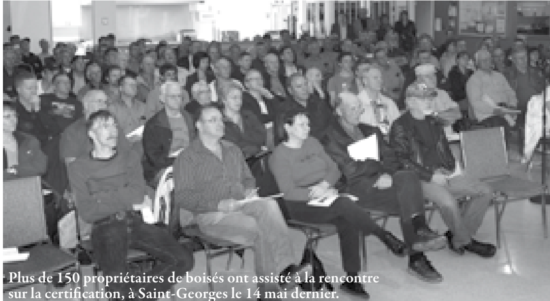
Plus de 150 propriétaires de boisés ont assisté à la rencontre sur la certification, à Saint-Georges le 14 mai dernier.

L'Association a rencontré 900 propriétaires de boisés dans le cadre de sa tournée d'information et de sensibilisation sur la certification, amorcée en janvier et terminée le 14 mai à Saint-Georges devant une assemblée de plus de 150 propriétaires.