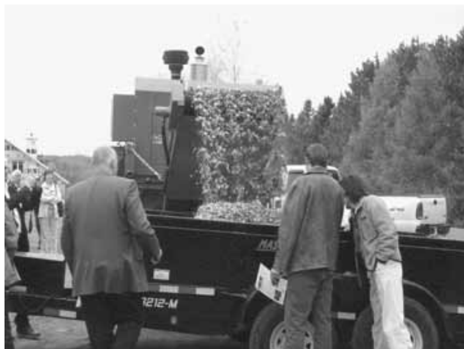
Démonstration de déchiquetage de sapins de Noël par Beloteq, en mai 2010 lors du Symposium énergie Etchemins 10, sous le thème J'me chauffe à la biomasse.

Il faut également considérer les impacts de récolter tous les déchets de coupe sur la fertilité des sols. En se décomposant, ces résidus procurent aux sols des éléments nutritifs essentiels à la forêt qui prend la relève. Les terrains où la fertilité du sol